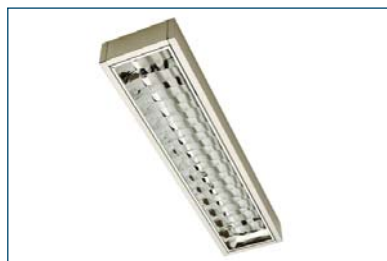
Polaris 214 F22