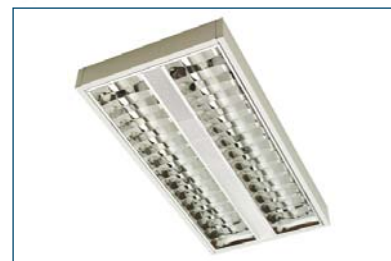
Polaris 414 F43