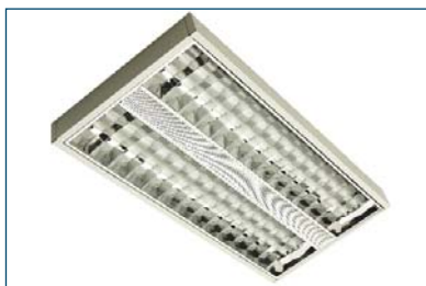
Polaris 214 B22