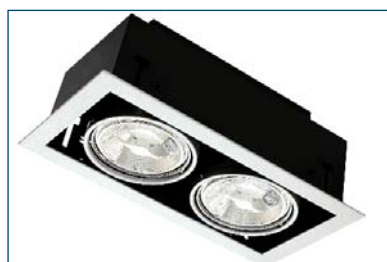
Pegasus 250 B30