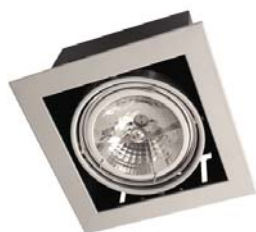
Pegasus 150 B29