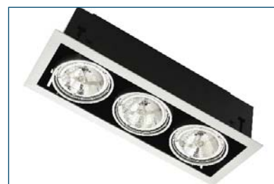
Pegasus 350 B31